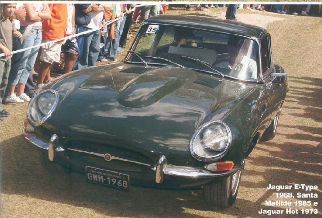
Jaguar E-Type 1968, Santa Matilde 1985 e Jaguar Hot 1973