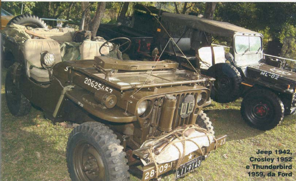
Jeep 1942, Crosley 1952 e Thunderbird 1959, da Ford